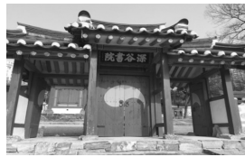
사진 속 건물은 조광조의 학문과 덕행을 추모하기 위해 설립된 심곡서원이다. 그는 사림의 여론을 바탕으로 왕도 정치를 실현하기 위한 개혁을 추진하였으나 훈구 대신들의 반발로 사사되었다. 그러나 선조 때 사림이 정치 주도권을 장악하면서 신원되었고, 그를 추모하는 서원이 여러 곳에 설립되었다.